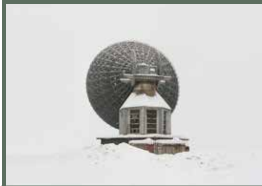
Restricted Areas © Danila Tkachenko